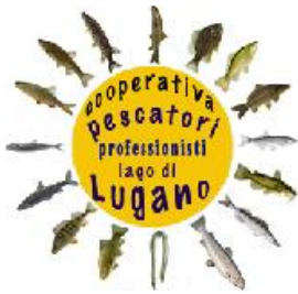
Il logo della cooperativa

porta immediatamente nella pescheria dove pulisce, filetta e infine stocca il pescato. Alcuni pesci con molte lisce vengono lavorati e rivalorizzati per produrre delle specialità come: il pesce in carpione, il pesce marinato, la bottarga, il paté, il pesce affumicato, la polpa di pesce, gli spiedini di pesce così come i filetti intagliati con una macchina rompi-lisce.