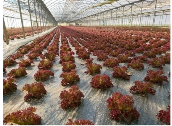
Figura 1: Una delle svariate serre dell'Azienda agricola Perozzi a Raizzino