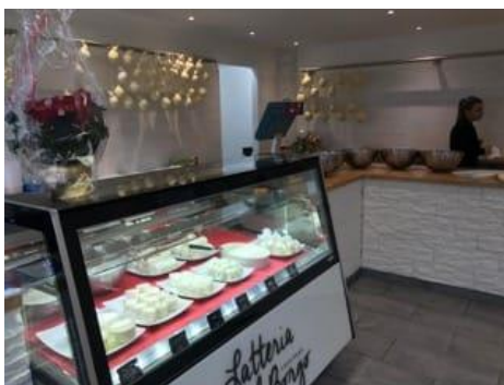
Il locale vendita della latteria a Faido

Un'azienda giovane ma che, grazie anche ai 27 anni di esperienza nel settore di Antonino, incontra la sua peculiarità nell'eccellenza produttiva, maturata attraverso la passione e l'accurata selezione della migliore materia prima: il latte. Il controllo totale di una filiera cortissima garantisce il raggiungimento degli elevati standard di qualità dei prodotti, infatti la materia prima è esclusivamente dell'Alta Leventina.