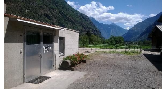
Il negozio per la vendita diretta presente in azienda