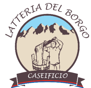
L'insegna del caseificio